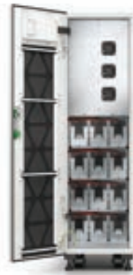
Nobreak Easy UPS 3S de 10 kVA com baterias internas