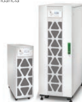
Nobreak Easy UPS 3S de 40 kVA com baterias externas