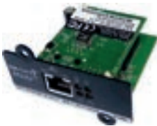
Placa de monitoração