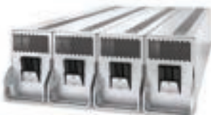
Módulo de bateria